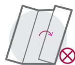
ALTAR- / FENSTERFALZ (6-SEITIG)