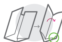
ALTAR- / FENSTERFALZ (8-SEITIG)