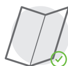
EINFACH- / MITTELFALZ