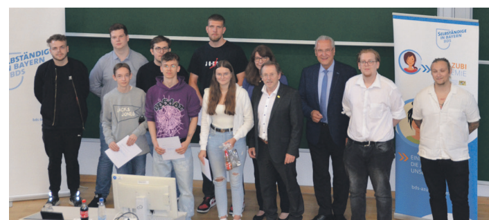
Bei der Übergabe der Zertifikate.

offen. Die Vorbereitungssitzung für das nächste Schuljahr findet am Donnerstag, 28.09.2023, 11.00 Uhr, im Landratsamt Neustadt a.d.Aisch, statt. Weitere Informationen und Anmelde-möglichkeiten finden Sie unter www.bds-azubiakademie.de .