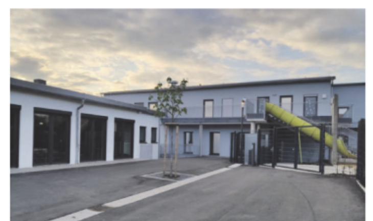
Der neue Campus am Taubergrund zeigt sich als modernes Bildungs- und Betreuungszentrum.