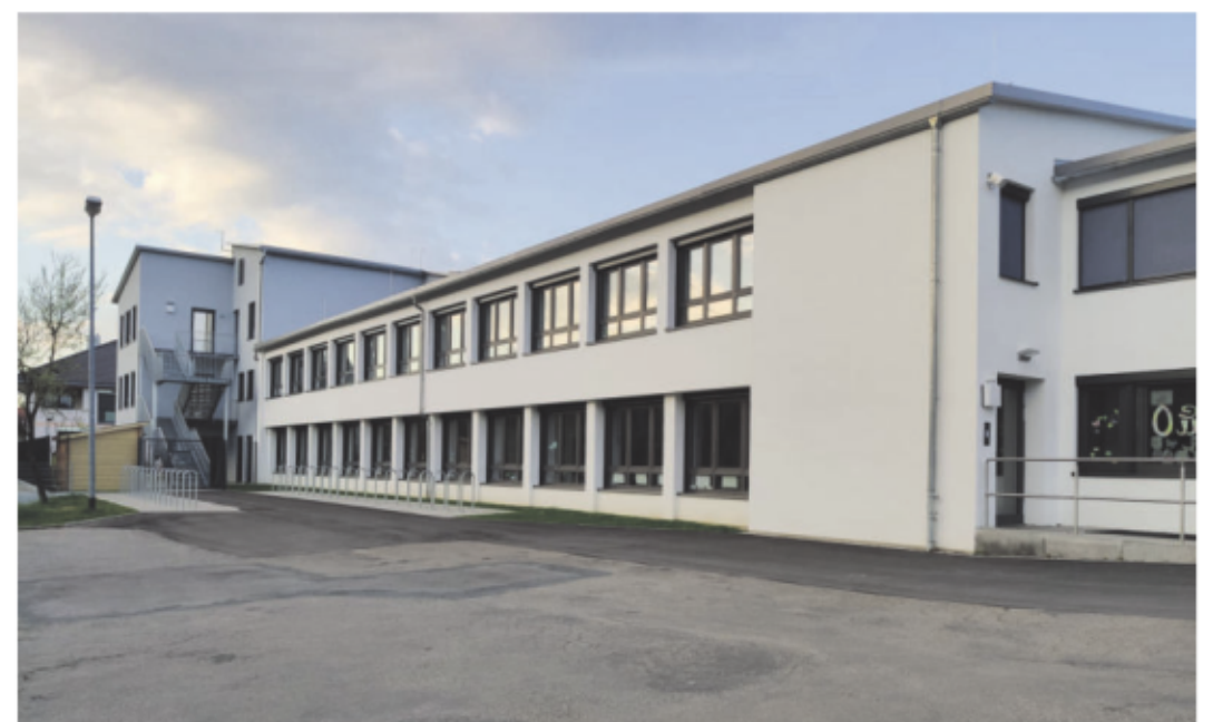
Eingeweiht wird der neue Campus in Edelfingen am 6. Mai.

Mit der neuen Namensgebung „Kita am Taubergrund Edelfingen und Taubergrundschule Edelfingen“ werde der Bezug zum „Campus am Taubergrund“ hergestellt. Das unterstreiche, „dass am Campus das gesamte Ange-