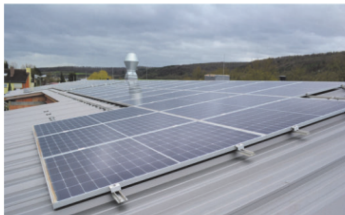
Der Campus ist unter anderem mit einer großzügigen Photovoltaik-Anlage ausgestattet.

Ein starkes Team sucht Elektroniker- / Elektroinstallateur als Monteur oder Obermonteur (m/w/d)