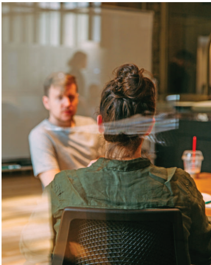
Dialog statt Monolog: Bei Vorstellungsgesprächen sollten auch Bewerber aktiv Fragen stellen.

So können Bewerber im Vorstellungsgespräch punkten