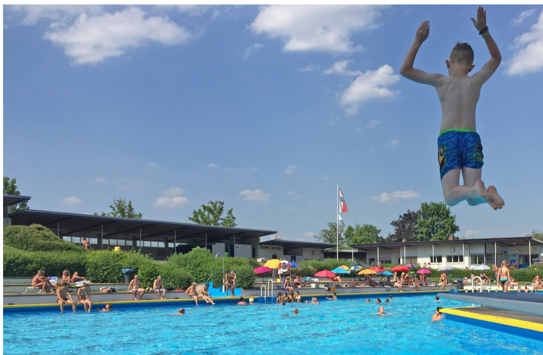
Die erhsehnte Freibadsaison 2022 kann starten.